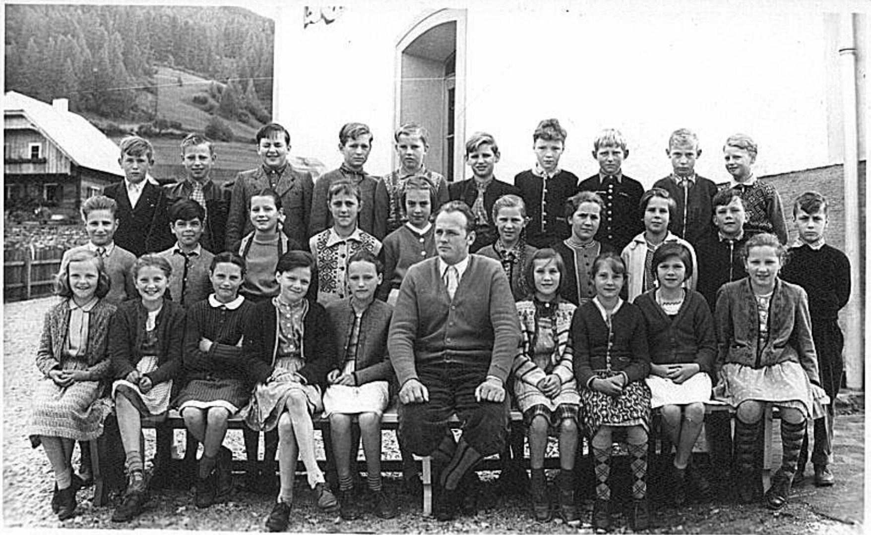
Hauptschule St. Michael. 1956-57.